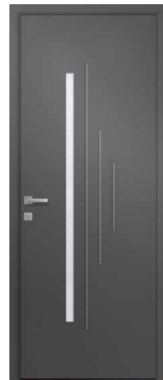
OCRE 1 Triple vitrage sablage uni Rainurage 2 faces