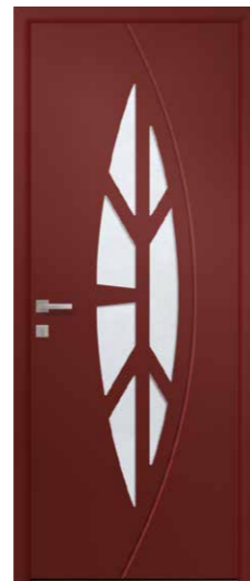
DIOPSIDE 7 Triple vitrage sablage uni Rainurage 2 faces