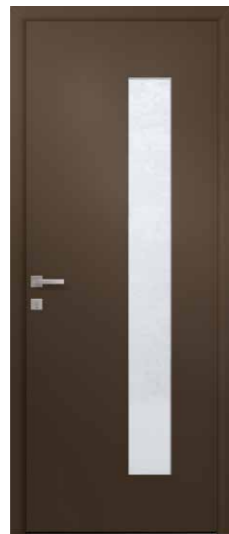
MEXICO 1 Triple vitrage sablage uni