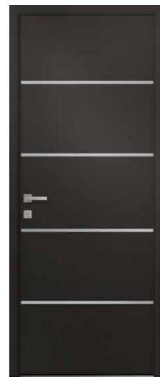
CELADON Alunox 2 faces inclus