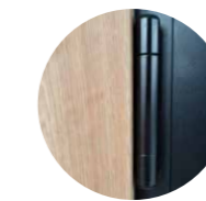
Zoom sur la paumelle SFS Noir ou Blanc