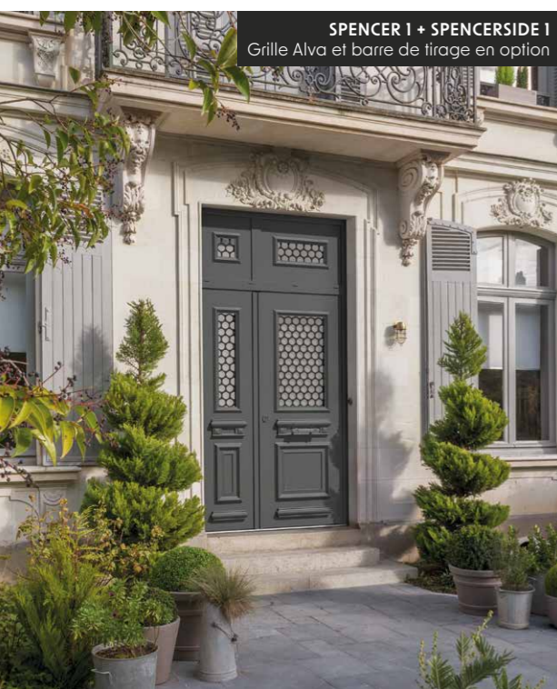
SPENCER 1 + SPENCERSIDE 1 Grille Alva et barre de tirage en option