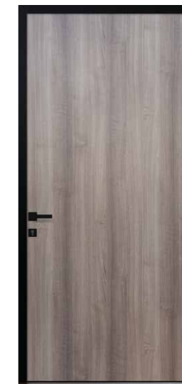
CEDAR Poignée noire sur les 2 faces de la porte incluse Dormant noir RAL 9005