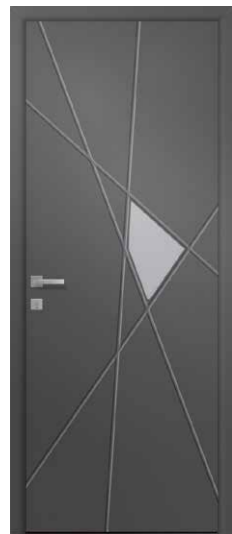
HIBISCUS Rainurage et alunox 2 faces inclus