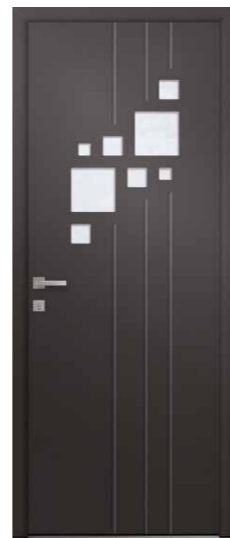
SODALITE 8 Triple vitrage sablage uni Rainurage 2 faces