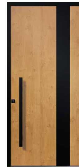
TECK Décor aluminium laqué inclus BT13 en option Dormant noir RAL 9005