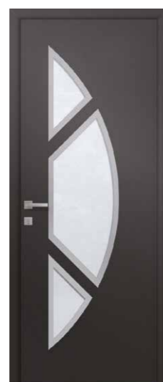
GOYA 3 Triple vitrage sablage uni Alunox 2 faces en option