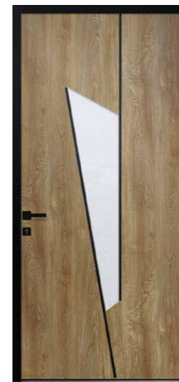
FACTORY 1 Triple vitrage sablage uni Poignée noire sur les 2 faces de la porte incluse Joncs alunox noirs inclus Dormant noir RAL 9005