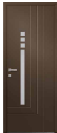
POURPRE Rainurage et alunox 2 faces inclus