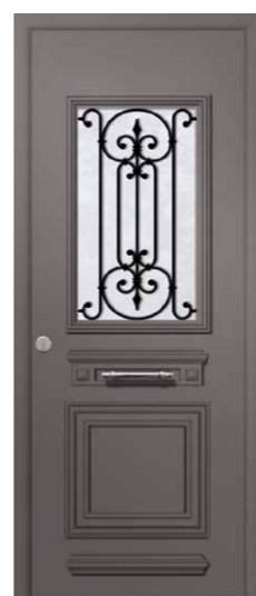
SPENCER 1 Triple vitrage Grille fonte d'aluminium Volutes et BT12 en option