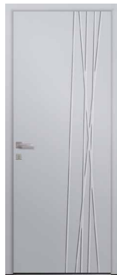
PARME Rainurage 2 faces