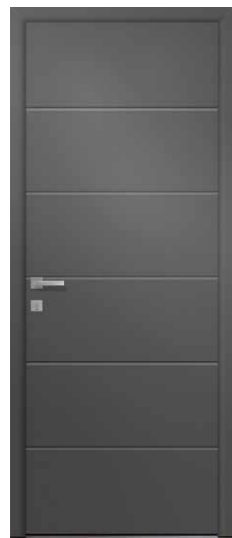
LILAS Rainurage 2 faces