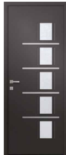
SELENE 5 Triple vitrage sablage uni Rainurage et alunox 2 faces inclus