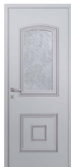
CAPELLA 1L Triple vitrage delta clair